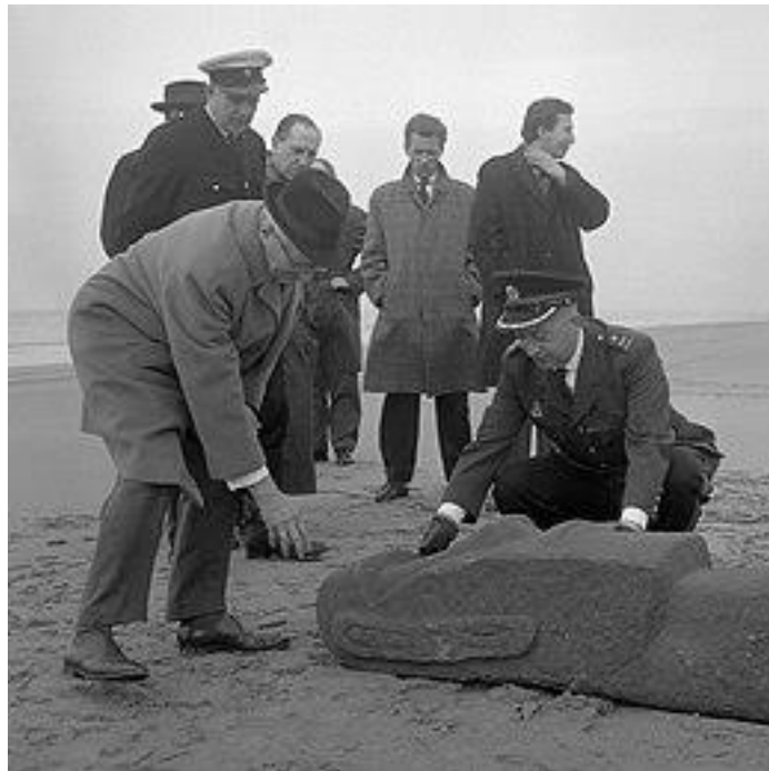
Zandvoort, 1 april 1962: een beeld van Paaseiland is aangespoeld.

De eerste vermelding in een Nederlandstalige bron dateert uit ca. 1560.