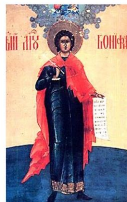
San Bonifacio di Tarso

I SANTI DI GHIACCIO (dall' 11 al 14 maggio)