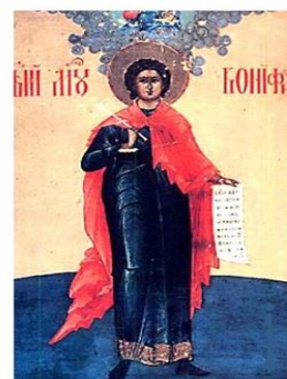
San Bonifacio di Tarso

I SANTI DI GHIACCIO (dall' 11 al 14 maggio)