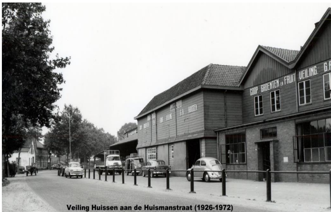
Veiling Huissen aan de Huismanstraat (1926-1972)